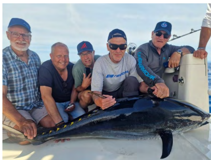
2024 die CSM-Truppe mit schönem Thunfisch.