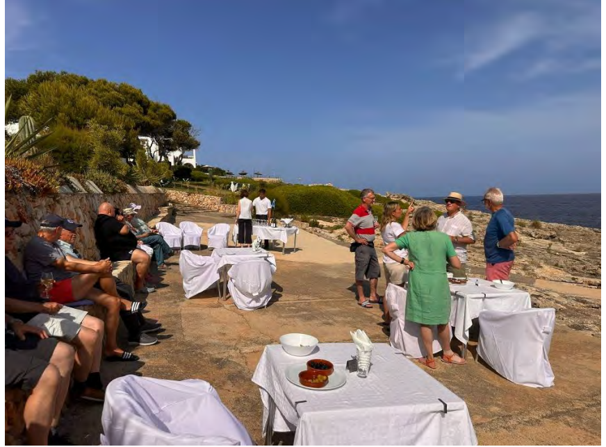
Apéro direkt am Meer, weil das so ein toller Start war, hiess es ab nun jeden Tag 18.00 Uhr Apéro.